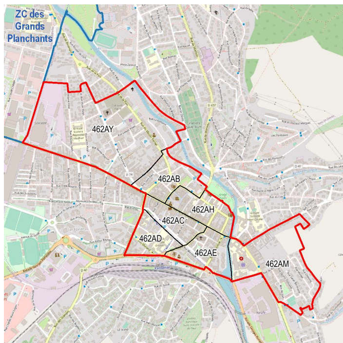
Centre-ville de Pontarlier